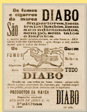
Propaganda Cigarros Diabo-JSLN

Muitos adentraram neste negócio, entre eles o escritor pelotense Simões Lopes Netto 2 , que construiu uma fábrica de cigarros de marca “Diabo”, o que gerou grandes protestos de religiosos na época.